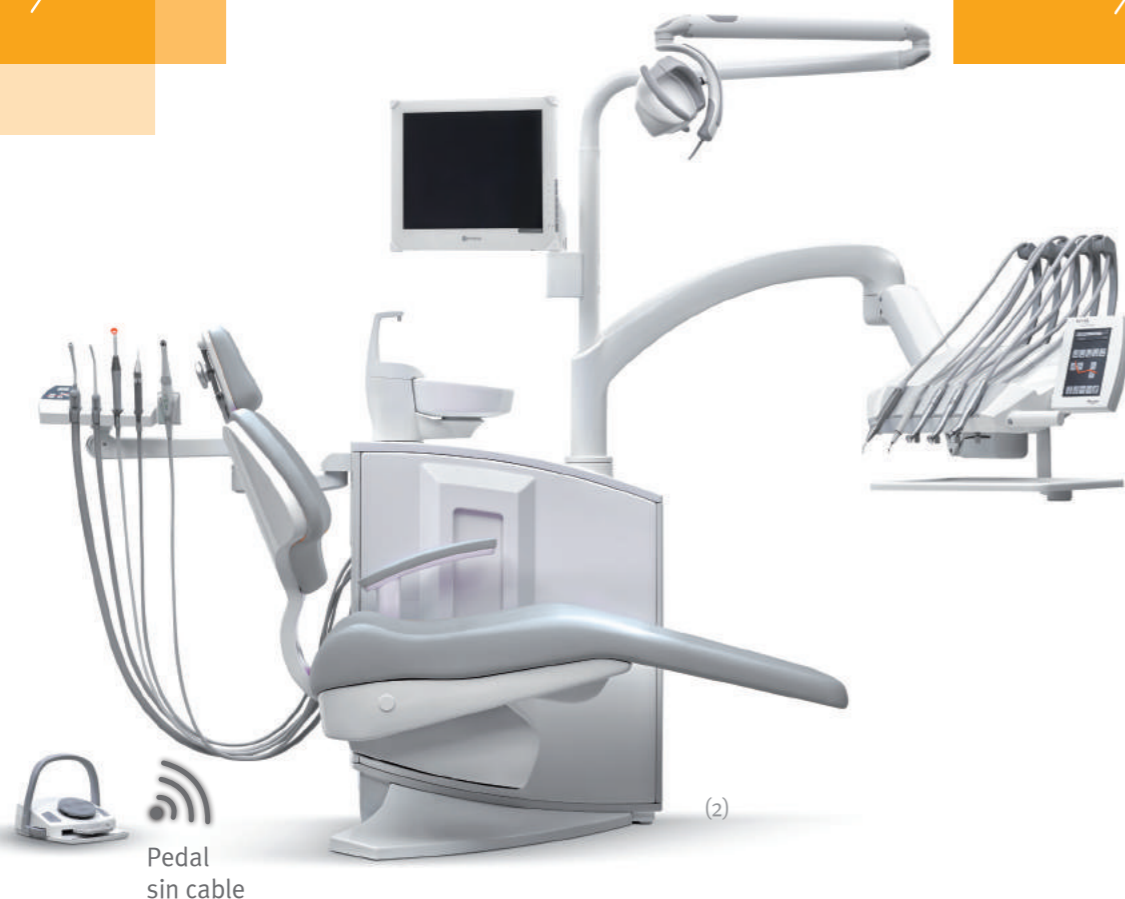
Pedal sin cable